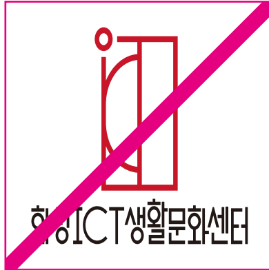
상하로 늘린 경우