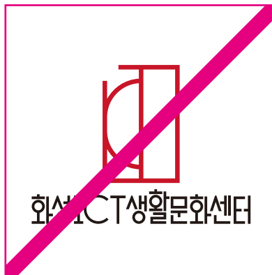
요소를 임의로 삭제한 경우