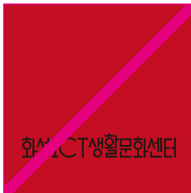
배경에 의해 요소가 삭제된 경우