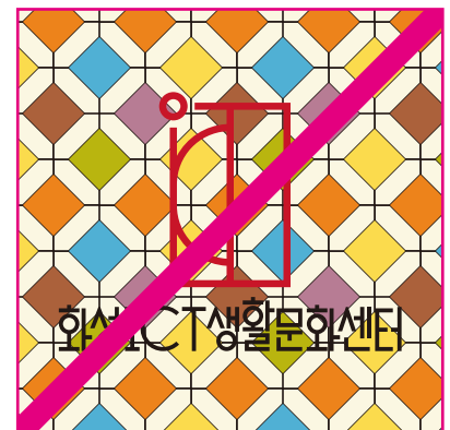
복잡한 배경 위에 적용한 경우