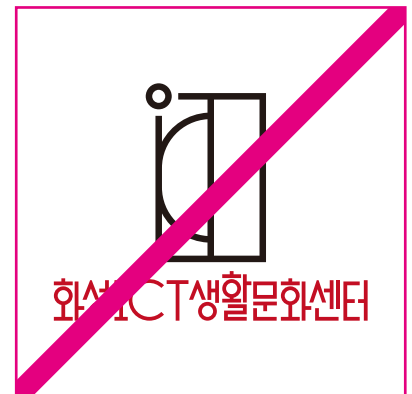
요소의 색상을 뒤바꾼 경우