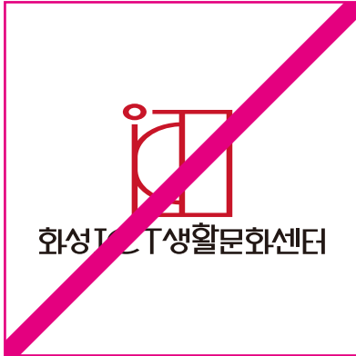
좌우로 늘린 경우

사용금지규정은 화성ICT생활문화센터 BI 규정에 벗어나게 사용하여 이미지의 혼동, 손상을 가져올 수 있는 경우를 예시한 것이다. 본 항에 예시된 금지규정 외에도 이미지를 왜곡시킬 수 있는 임의적 변형 및 활용을 하지 않는다.