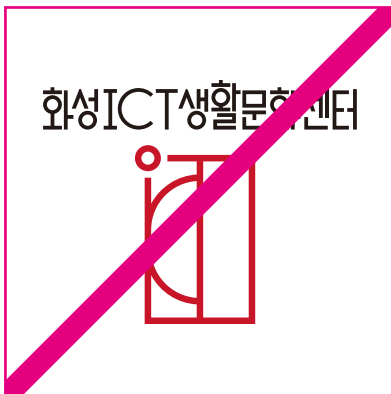
임의의 조합을 사용한 경우