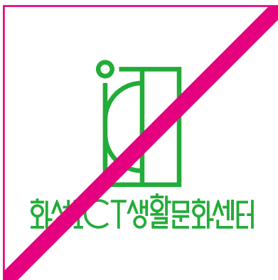
요소의 색상을 임의로 변경한 경우